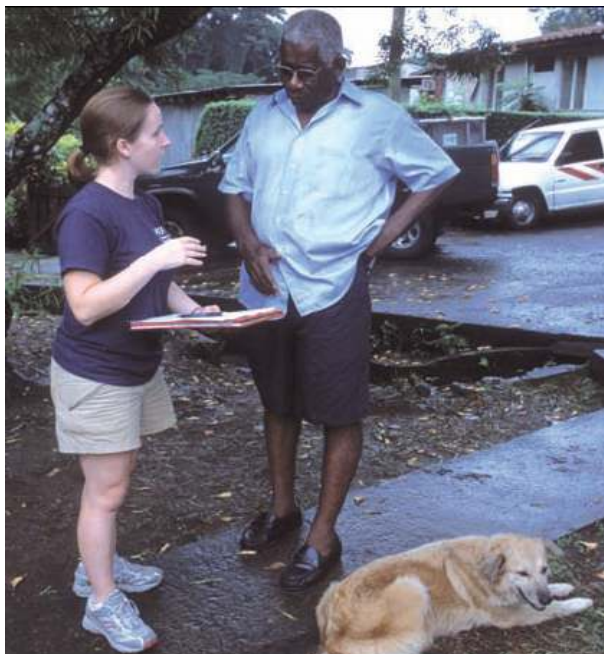
สำรวจความเห็นจากเจ้าของสุนัขในโดมินีกา