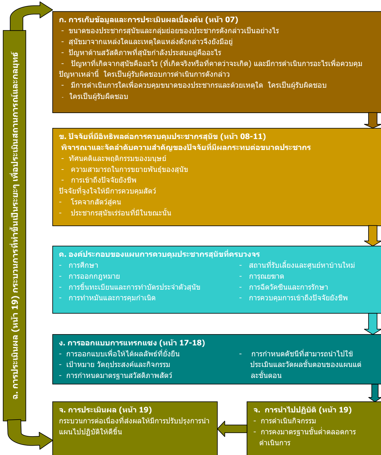
ภาพ 2 ภาพรวมกระบวนการ

คู่มือนี้มีโครงสร้างดังที่อธิบายในภาพ 2 ต่อไปนี้ : ภาพรวมกระบวนการ