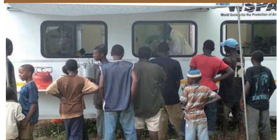
ชาวบ้านกำลังดูการผ่าตัดทำหมันทางหน้าต่างคลินิกเคลื่อนที่ในซานซิบาร์

ในปี 2549 มีเหตุการณ์ที่คล้ายคลึงกันในซานซิบาร์ เมื่อ WSPA และ รัฐบาลท้องถิ่นริเริ่มนำมาตรการแทรกแซงโดยการ ทำหมัน โครงการเริ่มต้นที่การได้รับความร่วมมือน้อย มีเจ้าของไม่กี่รายที่แสดงความประสงค์จะนำสัตว์มาทำหมัน อย่างไรก็ตามเวลาผ่านไปหลายเดือน การให้การศึกษาแลกเปลี่ยนความเห็นกับผู้นำชุมชนและตัวอย่างของสัตว์ที่ถูกทำหมันแต่ยังมีสุขภาพดี เริ่มสร้างความเปลี่ยนแปลงต่อทัศนคติของชาวบ้าน ชาวบ้านจึงเริ่มกระตือรือร้นนำสัตว์ของตนมาทำหมัน