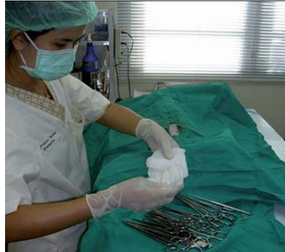
การผ่าตัดโดยใช้เทคนิคปลอดเชื้อ, ประเทศไทย

อาจอธิบายสวัสดิภาพของสัตว์ได้ ยกตัวอย่างเช่น การเกิดโรคแทรกซ้อนหลังผ่าตัดเป็นประจำ ภายในระยะเวลาหนึ่ง อาจบ่งบอกว่าจำเป็นต้องมีการอบรมเจ้าหน้าที่บางคนใหม่ หรือ เปลี่ยนวิธีการดูแลหลังการผ่าตัด