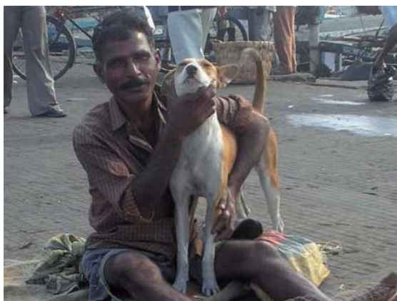
ชาวประมงและสุนัขชุมชนในประเทศอินเดีย